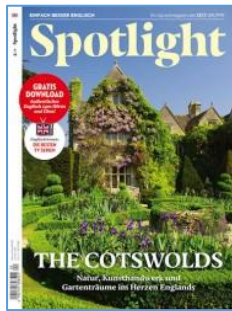
Spotlight 4/19 Title: The Cotswolds