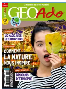
Géo Ado no 195 (mai 2019) Dossier : Quand la nature inspire la ville