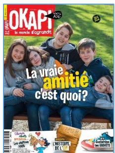
Okapi no 1088 (15 avril 2019) Dossier : Pourquoi l'or rend-il fou ?