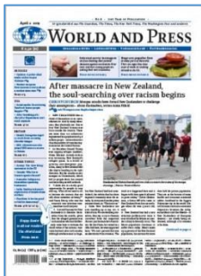
World and Press Avril 15 2019