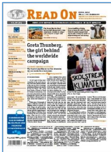
Read on 04 2019