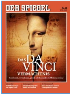
Der Spiegel Nr. 18 / 27.4.2019 Titel: Das Da Vinci Vermächtnis