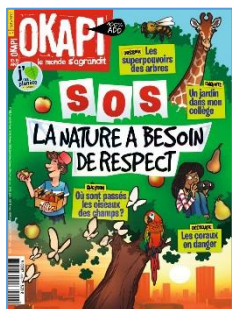
Okapi no 1089 (1 er mai 2019) Dossier : Les superpouvoirs des arbres