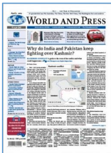
World and Press Avril 1 2019